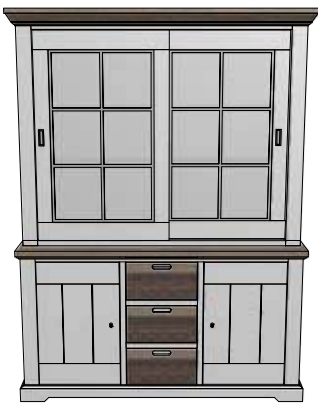
Art. 27925 208x155x45/35