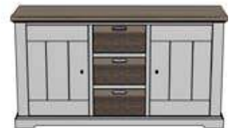
Art. 27938 85x155x45