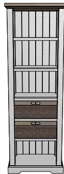
Art. 27929 187x65x35