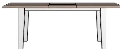
Malton Art. 26974 77x100x160/210 Malton Art. 26958 77x100x190/240