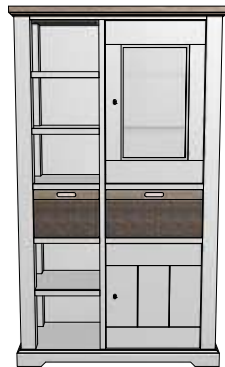
Art. 27927 190x110x45