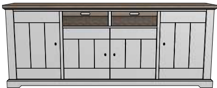
Art. 27920 90x225x45