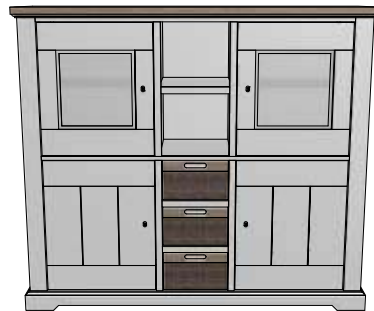
Art. 27926 140x160x45