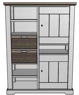
Art. 27928 160x120x45