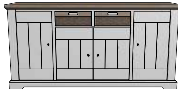
Art. 27921 90x180x45