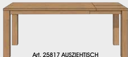
Art. 25817 AUSZIEHTISCH 90 X 145 CM. (+50 CM.) 77x90x145/195