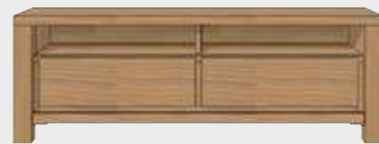
Art. 25814 TV-SIDEBOARD 2-LADEN + 2-NISCHEN - 160 CM. 55x160x45