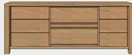
Art. 24621 SIDEBOARD 2-SCHIEBETÜREN + 2-LADEN - 220 CM. 85x220x45