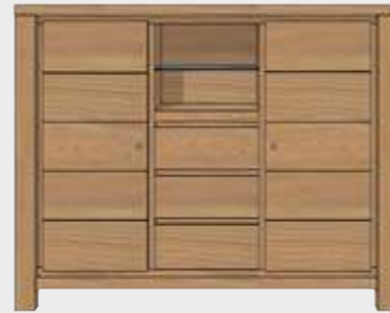
Art. 25813 HIGHBOARD 2-TÜREN + 3-LADEN + 2-NISCHEN 120x150x45