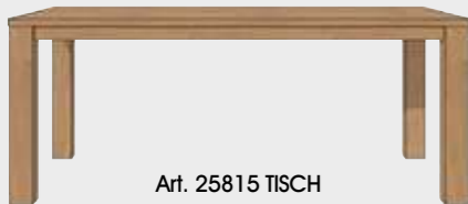
Art. 25815 TISCH 100 X 190 CM. 77x100x190