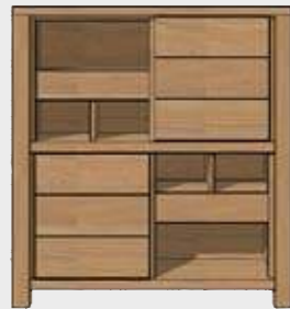
Art. 24625 SCHRANK 2-SCHIEBETÜREN + 2-LADEN + 6-NISCHEN 140x130x45