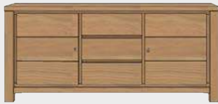
Art. 25812 SIDEBOARD 2-TÜREN + 3-LADEN - 190 CM. 85x190x45