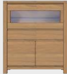
Art. 24636 HIGHBOARD 2-TÜREN + 1-LADE INNEN + 1-GLASKLAPPE + led 140x125x40