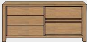
Art. 24620 SIDEBOARD 1-SCHIEBETÜR + 2-LADEN - 190 CM. 85x190x45