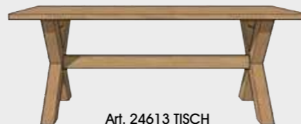
Art. 24613 TISCH 100 X 200 CM. MIT KREUZ FUSS 77x100x200