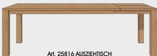
Art. 25816 AUSZIEHTISCH 100 X 190 CM. (+60 CM.) 77x100x190/250